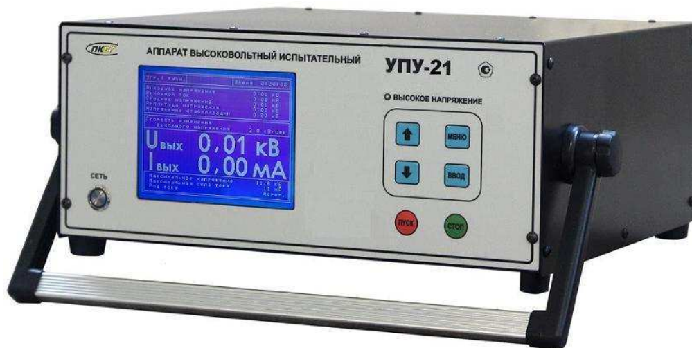
Рис. 1. Внешний вид аппарата УПУ-21.

Аппарат УПУ-21 представляет собой переносной прибор. Внешний вид аппарата приведён на рис. 1.