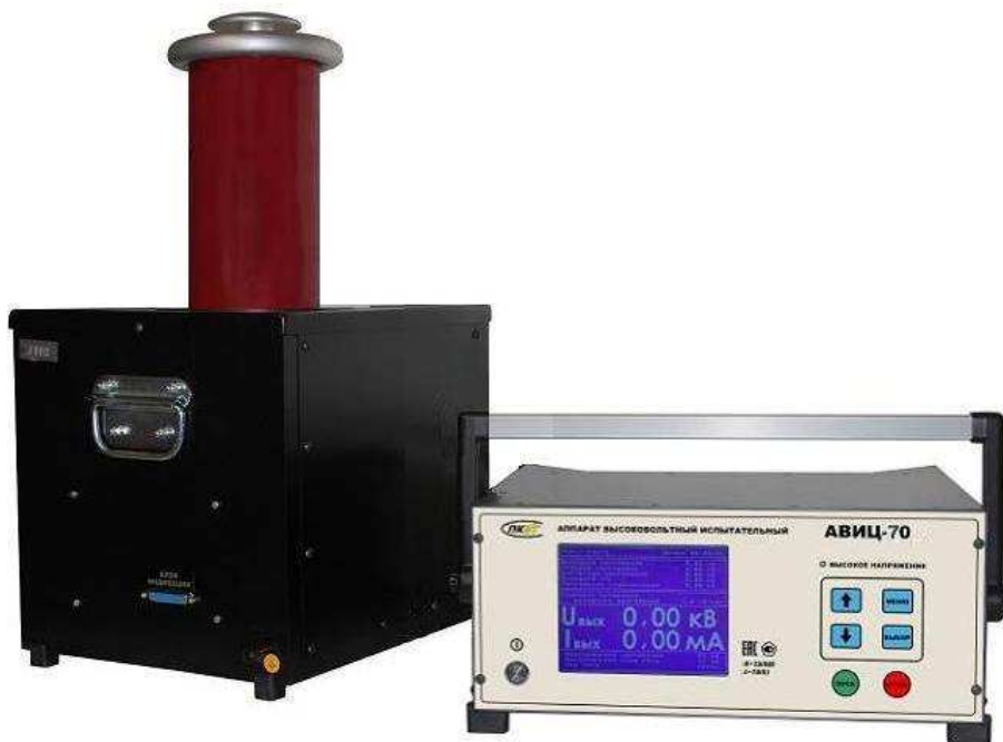
Рис. 1. Внешний вид аппарата АВИЦ-70.

Внешний вид аппарата приведён на рис. 1.