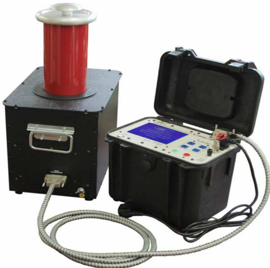
Рис. 1. Внешний вид аппарата АВИЦ-70.

Внешний вид аппарата приведён на рис. 1.